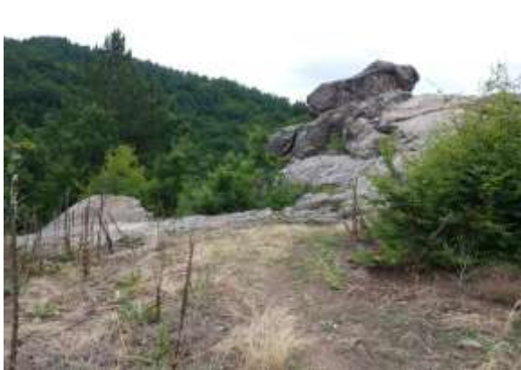
Поглед са Скобаљић града на државни пут и видиковац Соколица, локација за видиковац (означено са V_2 на Плану намене површине)