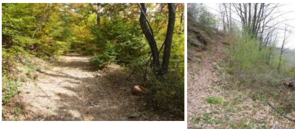
фотографија – прилазна стаза