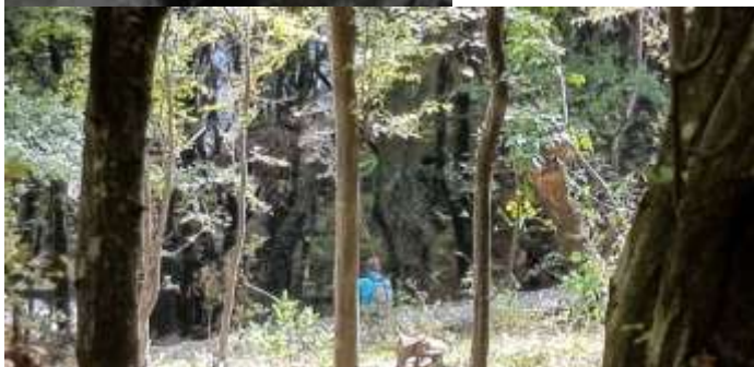
Одмориште на прилазној саобраћајници до Скобаљић града- према реци Вучјанки и Каналу, локација за одмориште (означено са O_1 на Плану намене површине)