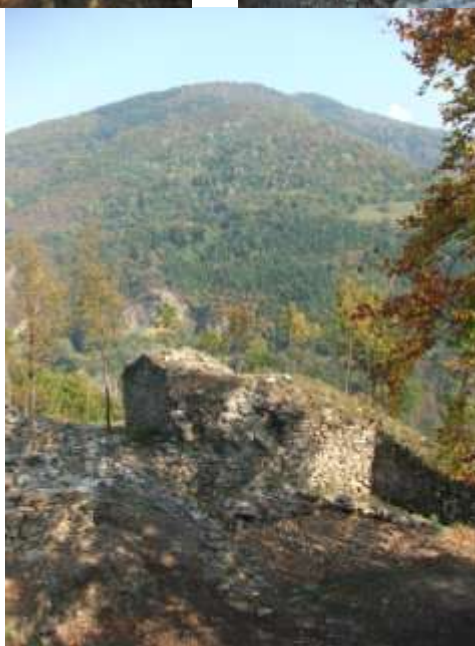
фотографије - Горњи град са Донжон кулом