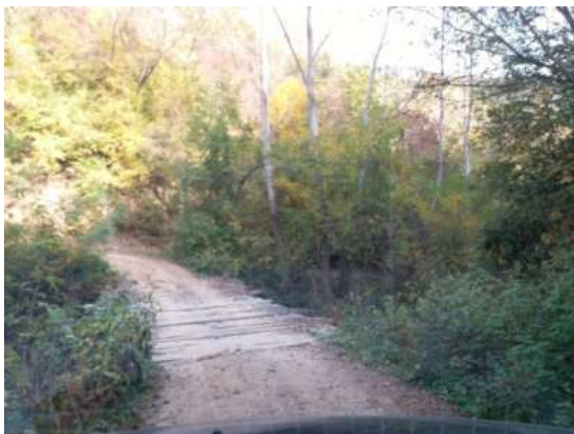
фотографија - дрвени пропуст на реци Вучјанки према налазишту