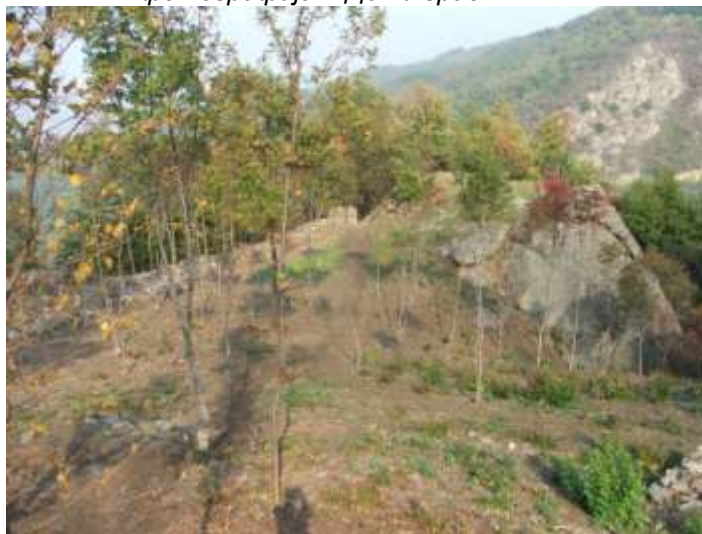
фотографија - Доњи град