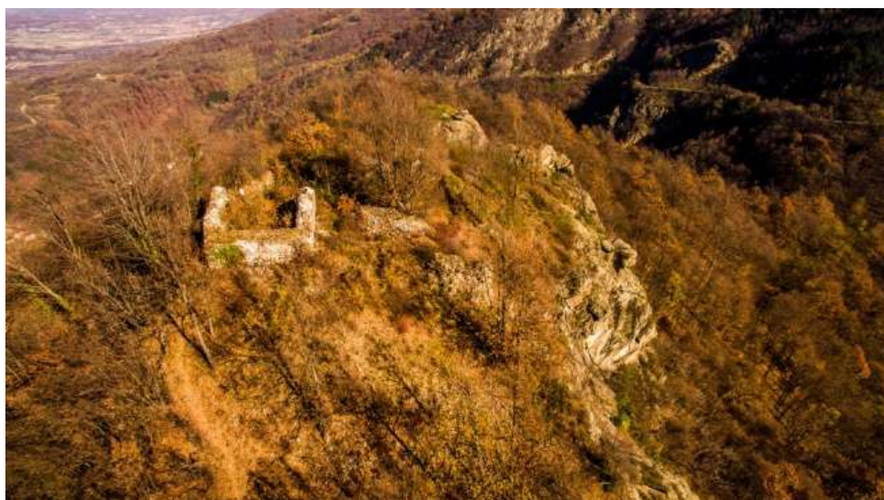
Скобаљић град, фотограмetriја, 2019.