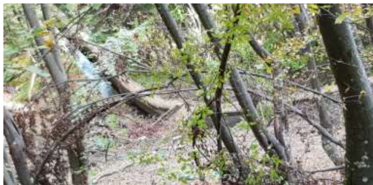
Канал хидроелектране "Вучјанке"