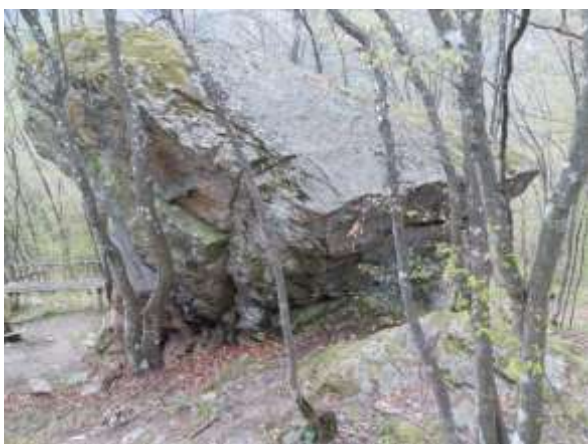
Одмориште на стази са прилазне саобраћајнице до Скобаљић града- осликана стена, локација за одмориште (означено са O_2 на Плану намене површине)