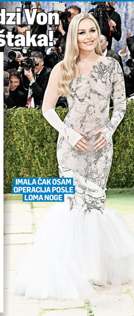
IMALA ČAK OSAM OPERACIJA POSLE LOMA NOGE

- Spust je jedan od najopasnijih sportova na svetu i to je rizik koji sam uvek rado preuzimala. Ovo je rezultat, ali ne žalim zbog toga - rekla je Vonova i potvrdila da je jedna od sportista s najčvršćim karakterom.