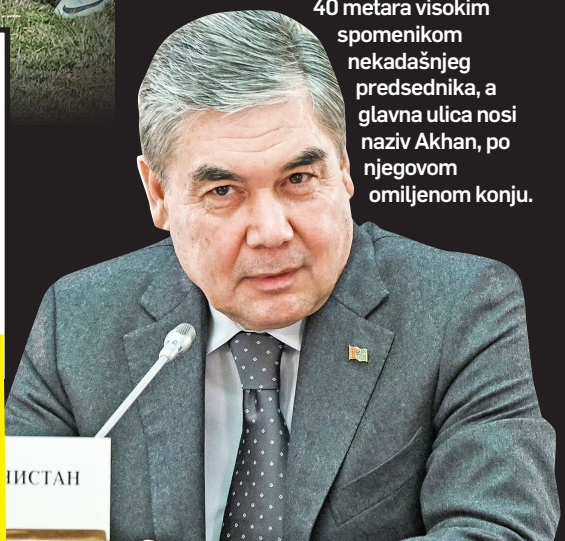
ČIK DA GA POBEDIŠ Gurbanguly Berdimuhamedov

→ Gurbanguli je na mestu predsednika nasledio sin Serdar i to posle izbora koji su međunarodne organizacije ocenile kao neregularne. Ipak, bivši lider i dalje ima važnu ulogu u upravljanju državom. Novi grad Arkadag ponosi se 40 metara visokim spomenikom nekadašnjeg predsednika, a glavna ulica nosi naziv Akhan, po njegovom omiljenoj konju.